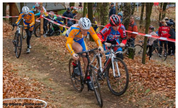
Beim Saisonfinale am

In Gelenau gingen über 190 Querfeldeinspezialisten, sowie Crossläufer ins Rennen. Unsere Sportler sicherten sich hierbei 3 Meisterschaftsmedaillen, sowie insgesamt 5 Podiumsplätze.