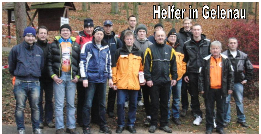
Helfer in Gelenau

Unser Verein war Ausrichter der sächsischen Bergmeisterschaft in Waldkirchen (03.10.) und der Mitteldeutschen Meisterschaft im Querfeldeinfahren in Gelenau (18.11.). Dank zahlreicher Sponsoren, vieler Helfer der Gemeinden und unseres Vereines, sowie toller Leistungen unserer Sportler, wurden beide Veranstaltungen zu einem echten sportlichen Höhepunkt im Erzgebirgskreis